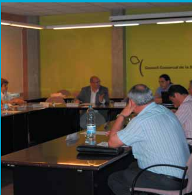
FOTO: reunió del Consell Director

La riquesa termal de Sant Hilari Sacalm és un tret de qualitat del municipi i ara, aquesta població, ha decidit adherir-se al sistema de qualitat de les viles termals, que és un programa que posa en valor aigües minero-medicinals de la població i Sant Hilari com a Vila Termal. El programa, que parteix d'una iniciativa de la Federació Espanyola de Municipis Termals, té l'objectiu de fomentar el turisme sostenible i d'afavorir una gestió dels recursos hidromineral que compleixi amb totes les exigències per a la utilització d'aquests recursos. Els resultats inicials emesos pels tècnics demostren que les empreses del poble tenen una gran qualitat i duen a terme una gestió molt bona del seu funcionament, entre les que hi ha l'empresa Font Vella, que és patrocinadora del projecte SELWA.