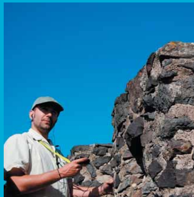
FOTO: parada d'interpretació de la e-ruta d'Hostalric

Durant el torn obert de paraula es va destacar la importància de restaurar i donar un ús lúdic a les rieres selvatanes, seguir treballant per a una futura edició de la guia de bones pràctiques en temes d'aigua dels sectors productius, potenciar el valor econòmic de l'aigua treballant amb mesures de tractament i de regeneració i la necessitat d'educar a nens i nenes a les escoles en matèries de sostenibilitat.