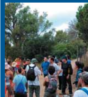
FOTO: instantànies dels penysegats i de les explicacions de la sortida