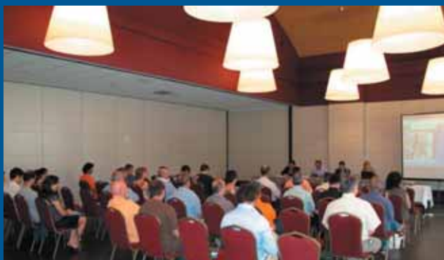
FOTO: instantània de la Jornada